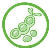
(6) SOIA E DERIVATI