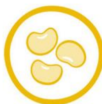
(13) LUPINI E DERIVATI