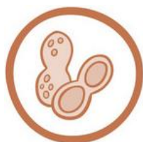
(5) ARACHIDIE DERIVATI