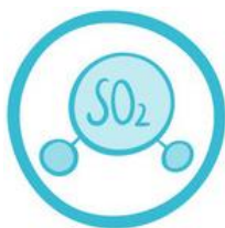
(12) ANIDRIDE SOLFOROSA e SOLFITI