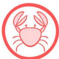
(2) CROSTACEI E DERIVATI