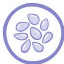
(11) SESAMO E DERIVATI