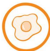
(3) UOVA E DERIVATI