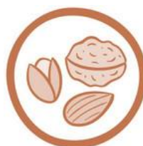
(8) FRUTTA A GUSCIO