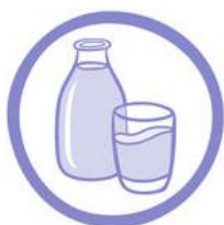
(7) LATTE E DERIVATI