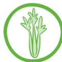
(9) SEDANO E DERIVATI