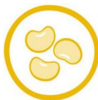
(13) LUPINI E DERIVATI