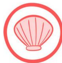
(14) MOLLUSCHI E DERIVATI

OCCHIO AL NUMERO! I numeri tra parentesi identificano l'allergene e vengono segnalati solo con i relativi numeri nella descrizione di ogni piatto.