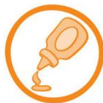
(10) SENAPE E DERIVATI